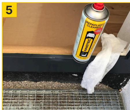
5 Untergrund wieder mit Repaplast Cleaner Antistatic und Multi Wipes gut reinigen (ca. 5 Min. ablüften lassen).