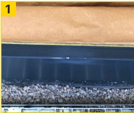
1 Grat mit ICECUT Discs (K320) entfernen.