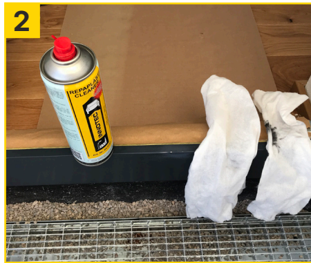
2 Untergrund mit Repaplast Cleaner Antistatic und Multi Wipes gut reinigen (ca. 5 Min. ablüften lassen).