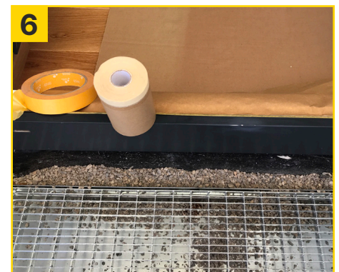
6 Umliegende Flächen mit SunCore Pro und Taiga Blue Core abkleben.