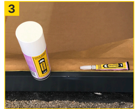
3 Kratzer mit Quick Bond auffüllen und Quick Bond Activator zum sofortigen Aushärten aufsprühen.