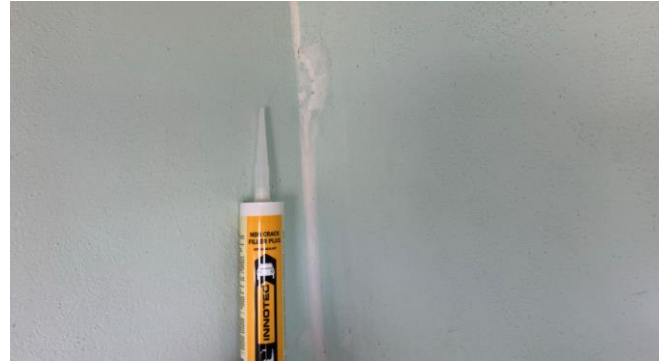
Der Non Crack Filler Structure kam vor allem im Innenbereich zum Einsatz.

Als krönender Abschluss wurde mit Stucco Spray eine neue Oberflächenstruktur aufgesprüht und mit der richtigen Farbe das Häuschen in Szene gesetzt. Dies verlieh dem Kassahäuschen nicht nur ein ästhetisch ansprechendes Aussehen, sondern schützt die Oberfläche auch vor zukünftigen Schäden.