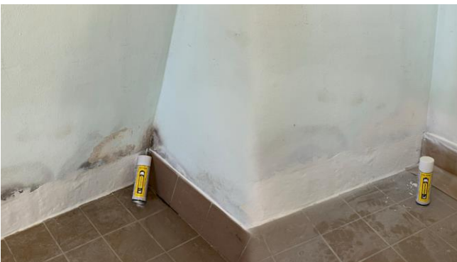
Vor der Anwendung des Isoliermittels waren die Schimmelflecken deutlich sichtbar.

Anschließend wurde Iso Prim eingesetzt, ein schnelltrocknendes und überstreichbares Isoliermittel, um Schimmelflecken dauerhaft zu isolieren und zu verhindern, dass sie durch die neuen Anstriche hindurchdringen. Mit Ultrafill , eine ultraleichte und universelle Spachtelmasse auf Wasserbasis, wurden alle Löcher und Ausbrüche im Innen- und Außenbereich zugespachtelt. Aufgrund seiner einzigartigen Zusammensetzung und kurzen Struktur, schrumpft Ultrafill während der Verarbeitung nicht und ist sehr einfach und schnell anzuwenden. Diese Spachtelmasse sorgt für eine glatte Oberfläche, bereit für die abschließenden Feinarbeiten.