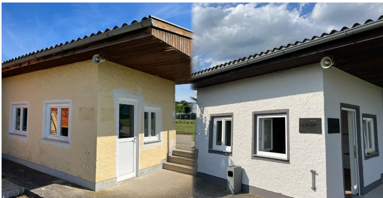
Front-/Queransicht des Kassahäuschens vor (links) und nach (rechts) der Aufbereitung.