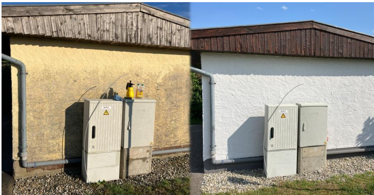
Rückansicht des Kassahäuschens vor (links) und nach (rechts) der Aufbereitung.