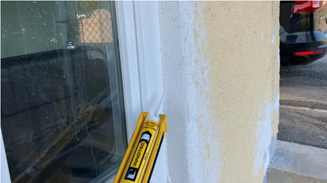
Mit dem Non Crack Filler Plus wurden die Anschlussfugen und Löcher im Außenbereich gefüllt.

Die Produkte Non Crack Filler Plus und Non Crack Filler Structure wurden für alle größeren Löcher, Anschlussfugen und Risse, sowohl im Innen- als auch im Außenbereich und unabhängig von der Oberflächenstruktur, eingesetzt. Diese Produkte überzeugen durch ihre einzigartige plasto-elastische, phthalatfreie und überstreichbare Dichtmasse auf Acrylatbasis und Acrylpolymerbasis.