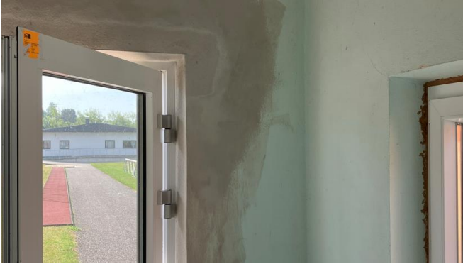
Abdichtung der Fenster & Türen mit Uniseal.