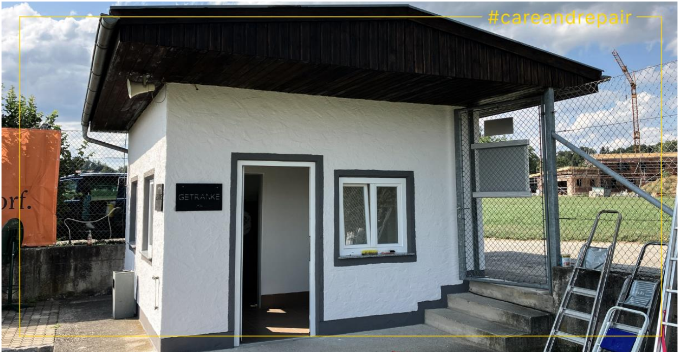
Das Kassahäuschen im zweiten Leben – nach der Renovierung mit Innotec-Produkten.

Wie ein altes Kassahäuschen mit Innotec-Produkten wieder zum Leben erweckt wurde.