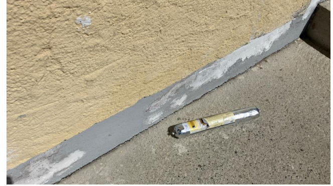
Die Außenmauer wurde ebenfalls an Teilbereichen mit Uniseal abgedichtet.

Anschließend wurde Iso Prim eingesetzt, ein schnelltrocknendes und überstreichbares Isoliermittel, um Schimmelflecken dauerhaft zu isolieren und zu verhindern, dass sie durch die neuen Anstriche hindurchdringen. Mit Ultrafill , eine ultraleichte und universelle Spachtelmasse auf Wasserbasis, wurden alle Löcher und Ausbrüche im Innen- und Außenbereich zugespachtelt. Aufgrund seiner einzigartigen Zusammensetzung und kurzen Struktur, schrumpft Ultrafill während der Verarbeitung nicht und ist sehr einfach und schnell anzuwenden. Diese Spachtelmasse sorgt für eine glatte Oberfläche, bereit für die abschließenden Feinarbeiten.