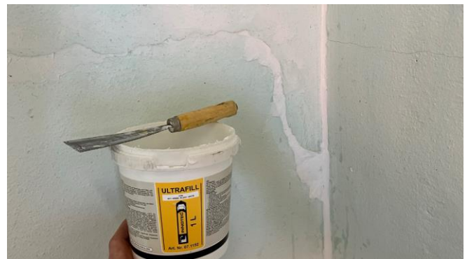
Mit Ultrafill wurden die Unebenheiten geglättet, um anschließend die Feinarbeiten zu vollziehen.